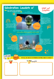
Panneau 2 TOUT est Création