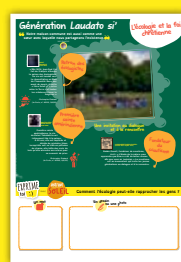
Panneau 3 L'écologie et la foi chrétienne