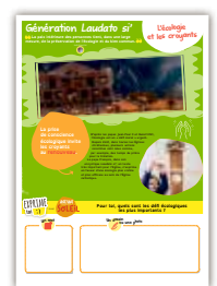
Panneau 5 L'écologie et les croyants