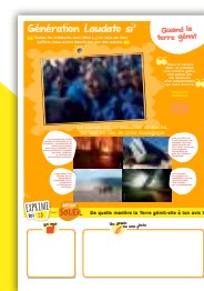
Panneau 4 Quand la terre gémit