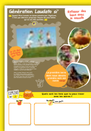
Panneau 7 Retisser des liens avec le monde