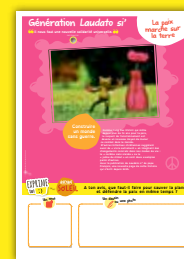
Panneau 9 La paix marche sur terre