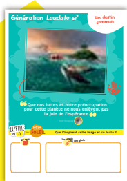
Panneau 1 Un destin commun

Par groupe, en classe ou même individuellement, les enfants sont invités à s'exprimer sur chaque panneau thématique par un mot, un dessin à partir d'une question.