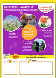
Panneau 6 La biodiversité dans tous ses états !