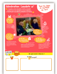
Panneau 10 Tous les âges se mettent au vert